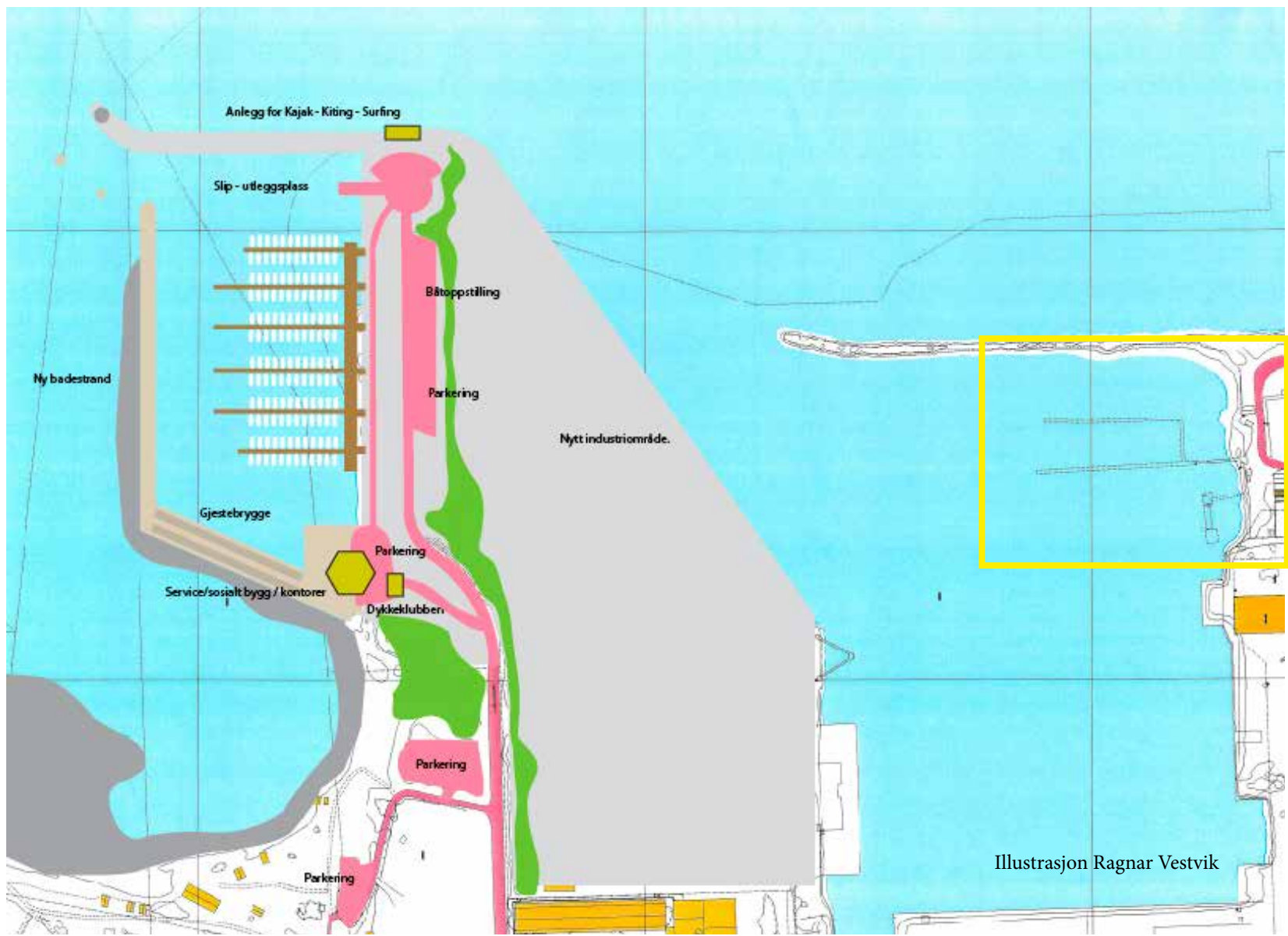
Illustrasjonen er ikke målsatt